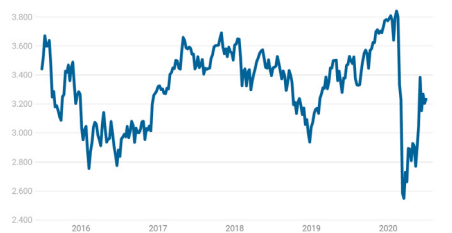
EURO STOXX 50